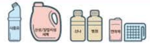
식용유 산성/알칼리성 세제 산소/벤젠 연마제/나일론 수세미